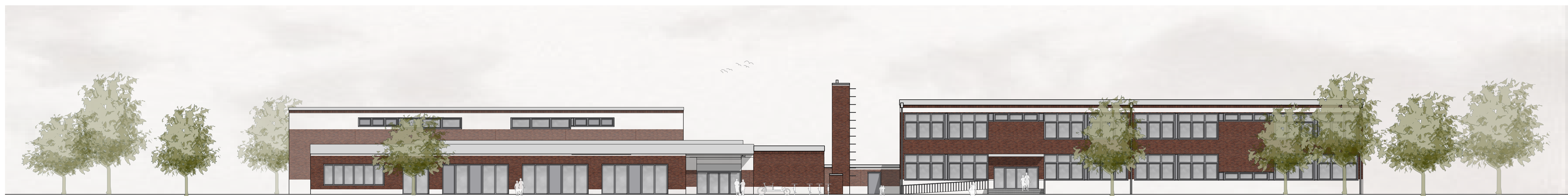
GT-AB | Ansicht Nord-West | Haupteingang M 1:200