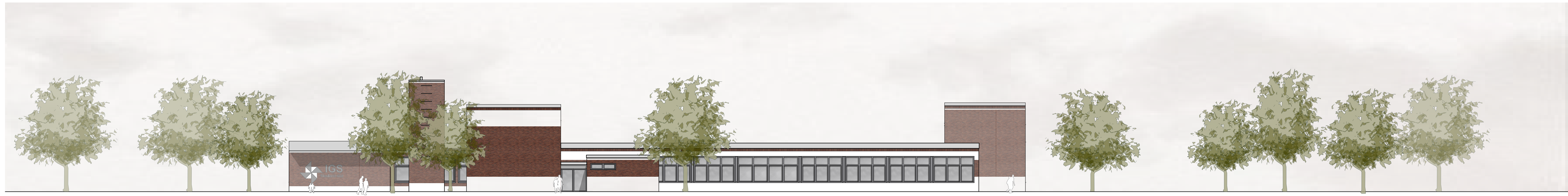
GT-AB | Ansicht Süd-West M 1:200