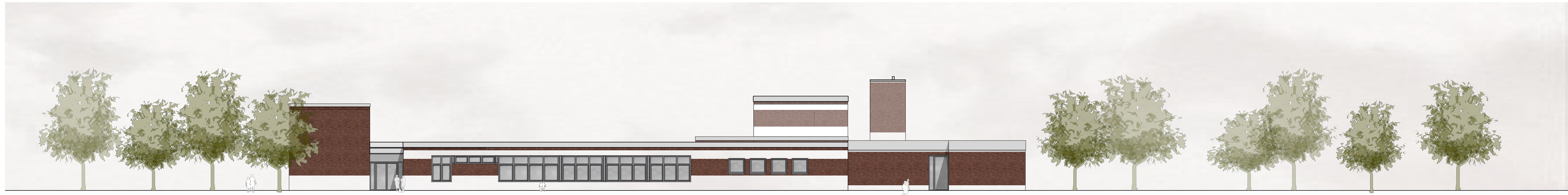
GT-AB | Ansicht Nord-West M 1:200