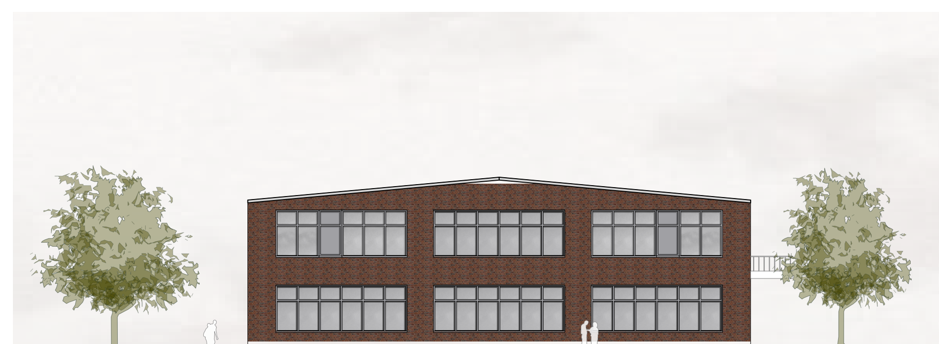
GT-AB | Ansicht Süd-West M 1:200