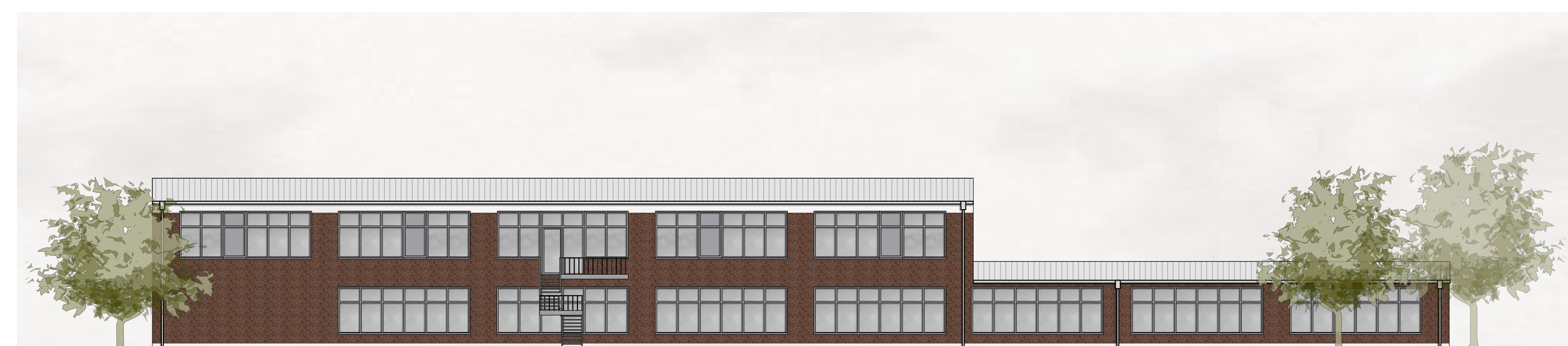
GT-AB | Ansicht Süd-Ost M 1:200