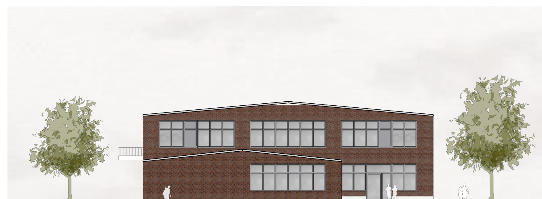
GT-AB | Ansicht Nord-Ost M 1:200