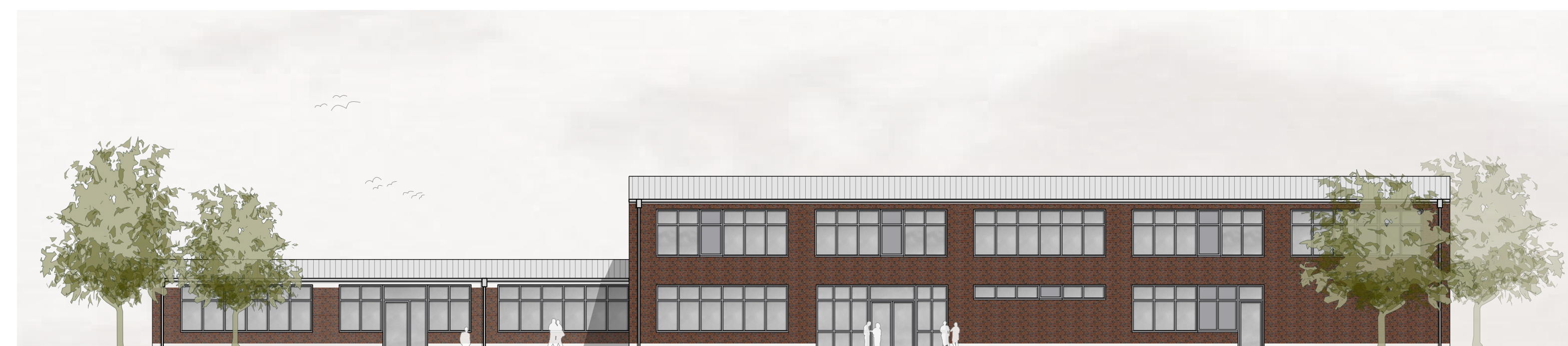
GT-AB | Ansicht Nord-West | Haupteingang M 1:200